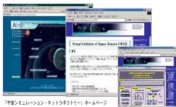
「宇宙シミュレーション・ネットラボラトリー」ホームページ

このACT-JSTプロジェクトは天文シミュレーションとの共同プロジェクトであり、SGEPSSと天文学会のスペースシミュレーションメンバーが一致協力しました。