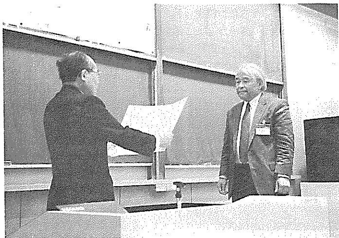
大家会長より長谷川記念杯を受けられる小口会員

停年をむかえて雑用から解放された今、学生にもどった気分で心から研究を楽しむことができそうな気がする。科学とは本来楽しみのためにするもので、いわゆる仕事ではない。外国にいくとよく、「日本の研究者は今でも土曜日に働いているのか？」と言う質問を受ける。私の答えは決っている。「いや、われわれは、土曜といわず普段の日でも働いている訳ではない。ただ研究というホビーを楽しんでいるだけだ。」自分自身のものを含めて、いままでとり貯めた資料だけでもホビーの種にはこと欠かない。世界中で、いかに貴重な資料がいかに