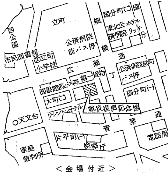
< 会場付近 >

会場： 仙台市戦災復興記念館 (仙台市大町二丁目12番1号) TEL (63)-6931